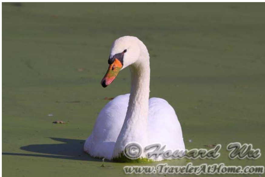
运河里的一只疣鼻天鹅

然后从乔治敦 (Georgetown) 处开始有 Chesapeake & Ohio Canal , 这是从Georgetown到西弗吉尼亚和马里兰交界处的Cumberland Gap的一条全长180余英里的运河(现已废弃), 河边的步行道属国家公园总署管理, 维护得很好, 去走一段也不错, 可以体会一、两百年前水路运输的历史(运河在乔治敦刚刚开始, 我在这个系列的第二、第三部分将继续提到)。