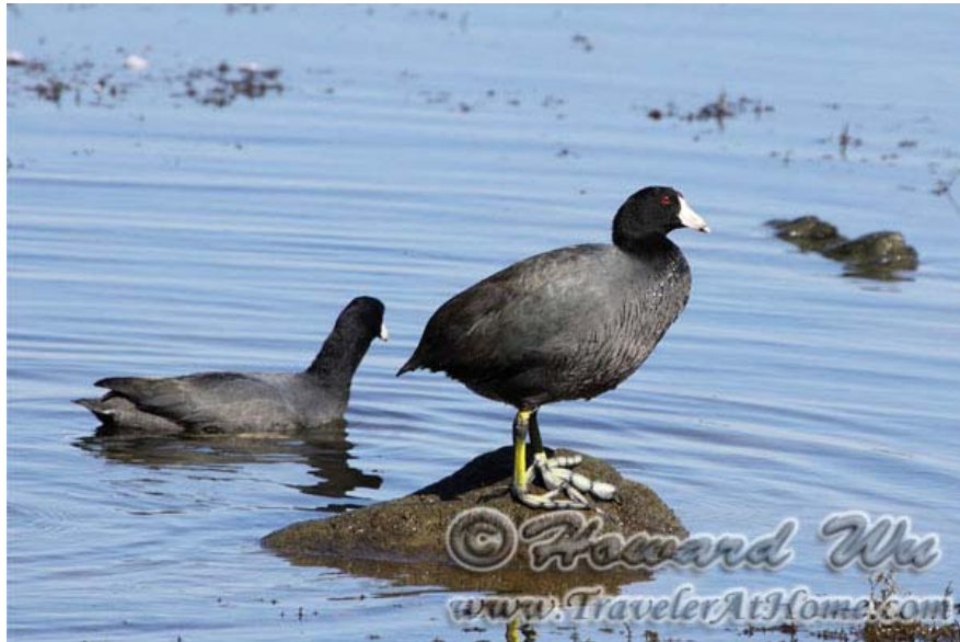
在Dyke Marsh处看到的American Coot

但是我最喜欢的去处是波多马克河(Potomac)河上的罗斯福岛( Theodore Roosevelt Island ), 此罗斯福非彼罗斯福, 这是老罗斯福)。要到达这里, 必须先沿 George Washington Parkway 开出城去, 然后停好车, 沿一个步行桥走到岛上去。岛上除了罗斯福雕像之外, 基本还是保留了自然生态, 常常可以看到很多水边栖息的动物, 尤其是红翅黑鸟(Red-winged Black Bird)。岛上低洼沼泽的地带建有木板步行道, 不会让你湿鞋。如果沿着George Washington Parkway继续往北开(这也是国家公园总署管理的一条风景公路), 路边有几处观景台, 也可以停下来俯瞰波多马克河和远眺华盛顿的市景。