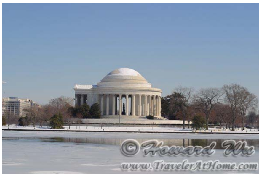
冬天的Tidal Basin和杰弗逊纪念堂

其次就是在DC里面有 Rock Creek Park , 从动物园处开始, 向北一直到和马里兰交界的地方, 沿着Rock Creek绿树成荫的一片。虽然在这里路上的车流仍然可以听到, 但走到树木稠密之处, 仿佛已经不在都市之中了。春天和秋天候鸟迁徙的时候, 这里更是鸟类的天堂, 常常得到许多惊喜。